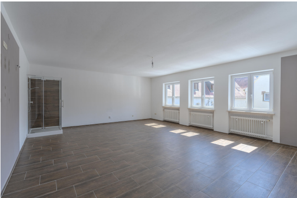
1. OG EZ Wohnung